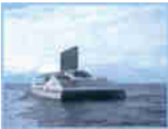
Figuur 7: Een schip van SolarSailor uitgerust met zonnecellen die tevens als windscherm dienen.