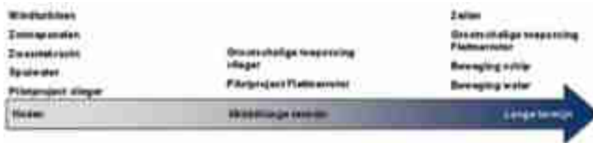
Figuur 11: De verschillende technologieën uitgezet op een tijdlijn.

Voor de implementatie is ook de termijn waarop de technologie beschikbaar komt voor de visserij belangrijk. Dit is reeds per technologie besproken in de vorige paragraaf. Figuur 11 geeft een overzicht van de termijnen waarop de verschillende technologieën naar verwachting ingevoerd kunnen worden. Voor de langetermijnopties geldt dat zij beschikbaar zijn mits er op de korte termijn onderzoek naar deze technieken wordt uitgezet zodat zij verder ontwikkeld worden.