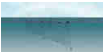
Figuur 1: Schematische afbeelding van een drijfnet.

Er werd destijds vooral gevestigd op haring, met drijfnetten (die 'vleten' werden genoemd). Een drijfnet is een passieve vorm van visserij waarin het net recht op staat in het water, met aan de bovenkant boeien en aan de onderkant gewichten. De vis wordt gevestigd doordat hij met zijn kieuwen of andere uitsteeksels in het net blijft hangen. In de maanden dat er niet op haring kon worden gevestigd, werd er gevestigd op verschillende andere soorten, zoals kabeljauw, ansjovis, et cetera.