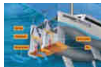
Figuur 10: Schematische weergave van de aandrijving van de Suntory Mermaid II.