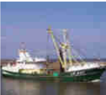
Figuur 3: Boomkorkotter met een motorvermogen van 2.000 pk.

Hoewel het aantal boomkorkotters sinds de jaren negentig duidelijk is afgenomen, is de boomkorvisserij ook nu nog de belangrijkste tak van de Nederlandse kottervloot. In 2006 werd ruim 80% van de totale visserij-inspanning gerealiseerd door de boomkorvisserij >1.500 pk (uitgedrukt in pk-dagen), en 63% van de totale besomming (opbrengst van de aangevoerde vis) van de Nederlandse vissersvloot [LEI, 2007].