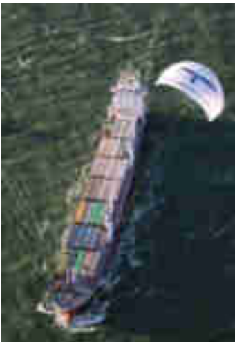
Figuur 4: Vrachtschip met Skysails.

3 Bron: SkySails GmbH & Co.KG, www.skysails.info , persoonlijke communicatie Dhr. H. Kuehl. Op de website kunnen ook een aantal filmpjes worden bekeken waarin de techniek wordt toegelicht, en de toepassing in de praktijk wordt gedemonstreerd.