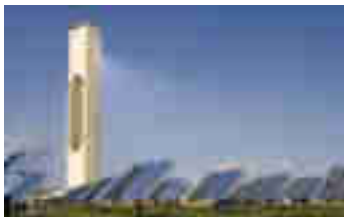
Figuur 8: De PS10 Solar power tower bij Sevilla, een grootschalig SCP-systeem waarbij verschillende heliostaten zonlicht projecteren op de centrale toren.

Er zijn twee typen CSP, namelijk solar thermal (CST) en photo voltaic (CPV). Bij solar thermal wordt het gebundelde zonlicht benut om een vloeistof te verwarmen. Deze warmte kan vervolgens direct gebruikt worden of worden omgezet in elektriciteit. Bij photo voltaic wordt het zonlicht geprojecteerd op zonnecellen die het direct in elektriciteit omzetten. Doordat het zonlicht wordt gebundeld, wordt het efficiënter benut dan met conventionele zonnepanelen. Met deze techniek kunnen dan ook erg hoge rendementen worden behaald. Voor de toepassing op schepen zal photo voltaic beter geschikt zijn dan CST, omdat hiermee direct elektriciteit geleverd wordt en een installatie voor elektriciteitsproductie uit warmte achterwege kan blijven.