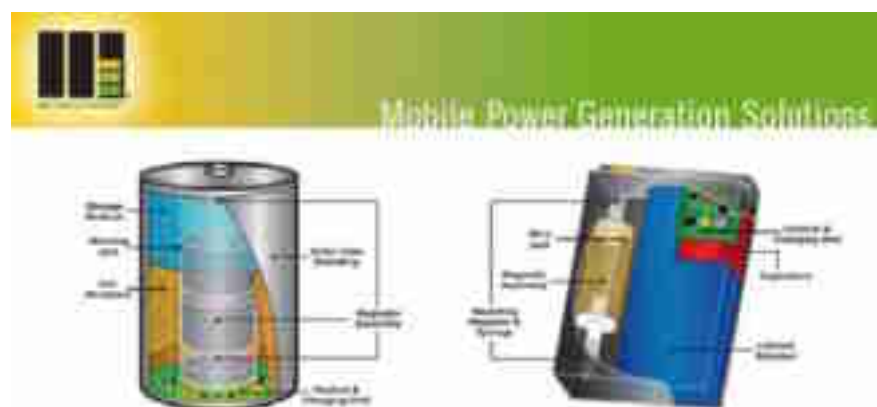
Figuur 9: Schematische weergave van de M2E power technologie.

De twee hierboven beschreven technieken zouden kunnen worden vertaald naar de situatie aan boord. De bewegende pols en het schud-