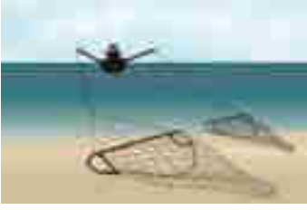
Figuur 2: Boomkor-vistechiek. Bron: www.zeeinzicht.nl . Tekening: Oscar Bos.

aan elke kant van het schip één. Grotere motorvermogens maakten het gebruik van steeds zwaardere kettingen mogelijk, waarmee de lucratieve tongvangst werd opgevoerd. De grotere winsten leidden tot steeds grotere motorvermogens – van 150 pk tot 500, 600, 800 pk en meer. Werken met de boomkor was de eerste tijd gevaarlijk (er gebeurden veel ongelukken), maar de techniek werd verder ontwikkeld, waardoor de veiligheid sterk verbeterde. Het vaargebied van deze schepen breidde zich uit van de kust tot de Noordzee.