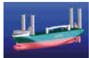
Figuur 6: Tekening van het schip E-ship 1, een Flettner-schip van het Duitse bedrijf Enercon. Bron: www.enercon.de .