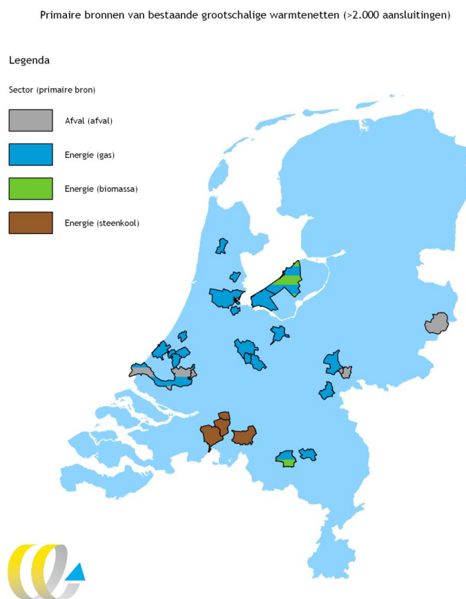
Figuur 1 Overzicht bestaande grootschalige restwarmtenetten en primaire bron

In Figuur 1 zijn de gemeentegrenzen van de reeds bestaande grootschalige warmtenetten (> 2.000 aansluiting) weergegeven inclusief de leverende sector en primaire bron. Uit Figuur 1 blijkt dat het overgrote deel van deze warmtenetten is aangesloten op energiecentrales die als primaire bron aardgas hebben. In de Bijlage A staat het overzicht van deze warmtenetten met meer specifieke kenmerken.