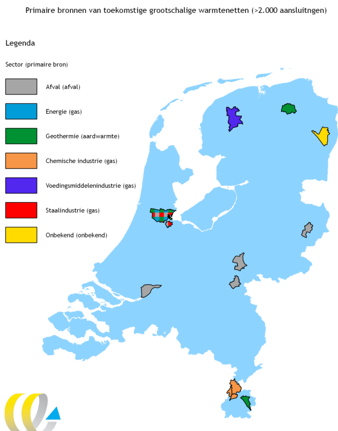
Figuur 2 Overzicht toekomstige de grootschalige restwarmtenetten en primaire bron

In Figuur 2 zijn de gemeentegrenzen van de toekomstige 1 grootschalige warmtenetten (> 2.000 aansluiting) weergegeven, zover nu bekend, inclusief de leverende sector en primaire bron. Meerdere warmtenetten worden op afvalverbrandingsinstallaties aangesloten. In de Bijlage A staat het overzicht van deze warmtenetten met meer specifieke kenmerken.